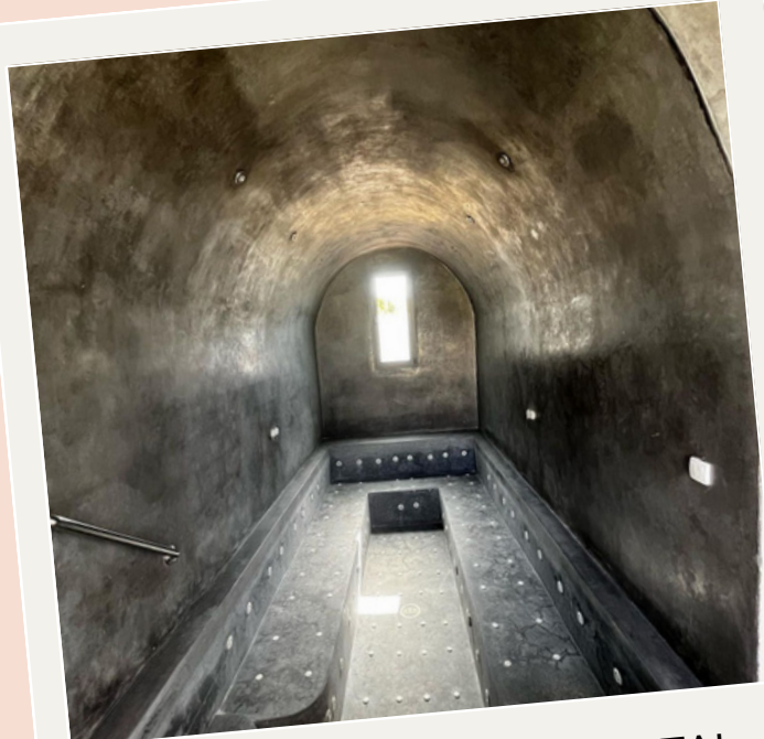
HAMMAM & JACUZI ORIENTAL