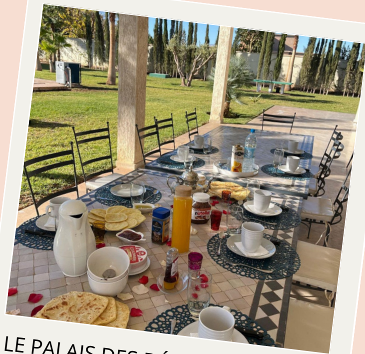
LE PALAIS DES DÉLICES