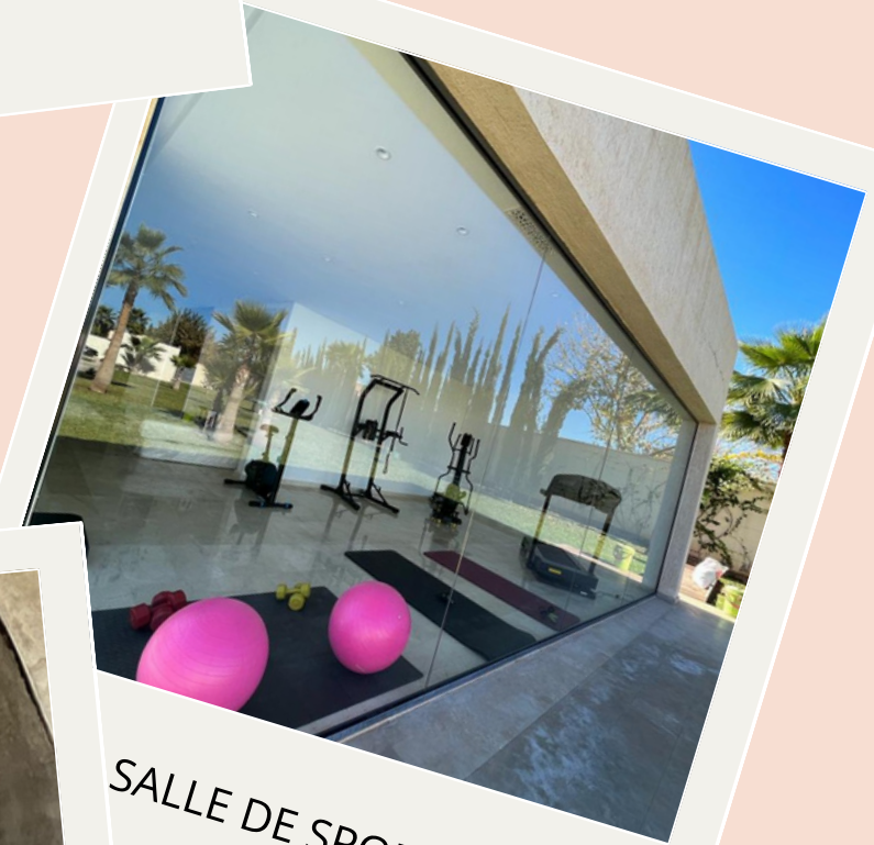
SALLE DE SPORT