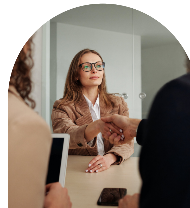
VALORISATION DE COMPÉTENCES