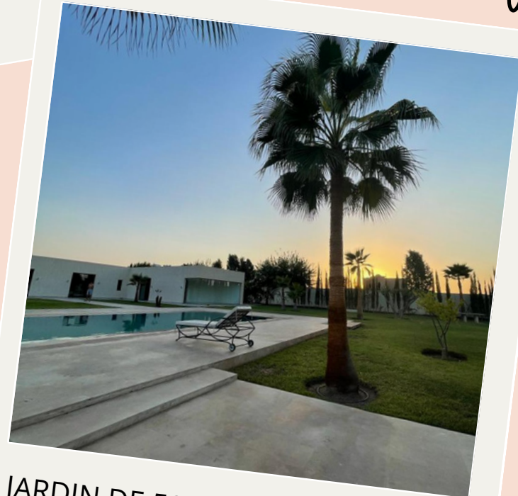
JARDIN DE 5000 M2