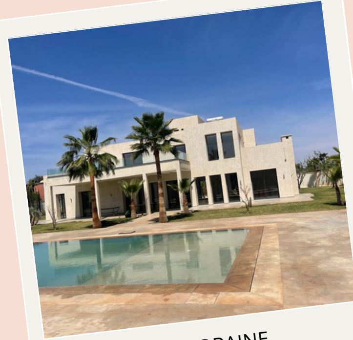
VILLA CONTEMPORAINE DE 700 M2